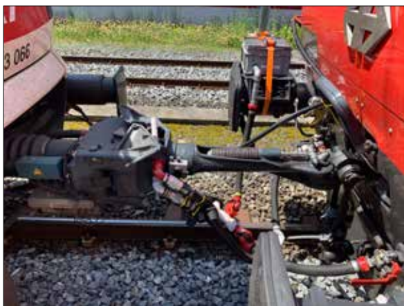
Composition d'essai (RABe 523 et Re 460 attelées l'une à l'autre par le biais d'un équipement spécial) en gare de Sargans (17 mai 2022).

ferroviaire), d'améliorer la ligne historique (29,51 km) via un nouveau tunnel à double voie shuntant Chambrerien et un autre ouvrage à voie unique en lieu et place des tunnels des Loges (long de 3259 m) et du Mont-Sagne (1354 m). Ménageant une capacité de deux IR (tracés en 22 min) et de deux R (en 28 min) par heure, cette modernisation avait été estimée à 840 millions de francs suisses (environ 875 millions d'euros). En plus du report du trafic de et vers le Val-de-Travers via une nouvelle section de Corcelles à Bôle (en lieu et place de l'itinéraire via Auvernier) à créer, il avait été envisagé de réaliser une troisième voie, de Neuchâtel au tunnel du Gibet, afin de soulager la double voie en direction d'Yverdon-les-Bains. Établie en